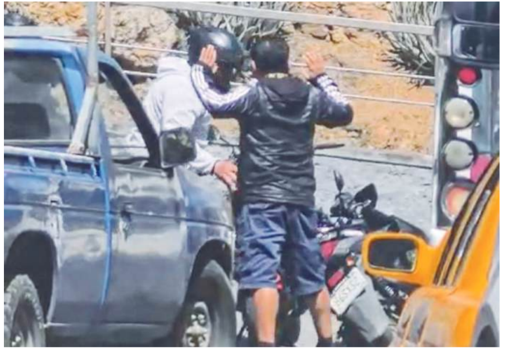
Presuntamente la víctima fue amagada con un arma de fuego.