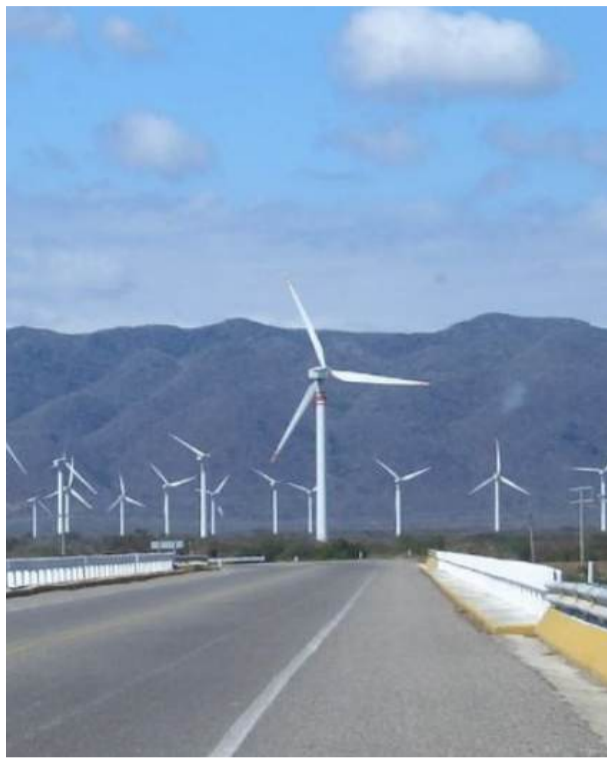
Vientos fuertes y lluvias alertan a la población del Istmo ante la llegada del Frente Frío 12.

Las autoridades de Protección Civil reiteran el llamado a la población a mantenerse informada a través de los canales oficiales, extremar precauciones en tramos carreteros y asegurar objetos que puedan ser arrastrados por el viento.