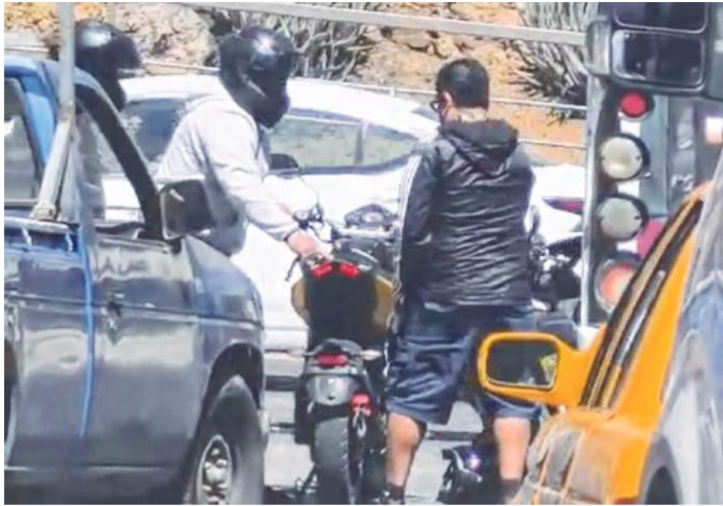
En el cruce de Crespo y calzada Héroes de Chapultepec se consumó el robo.