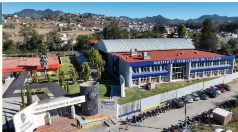
En el Tecnológico de Tlaxiaco, la base trabajadora de la Delegación Sindical D-V-72 de la Sección 61 del SNTE, está de brazos caídos.

Compromiso del sindicato: La Delegación Sindical D-V-72 de la Sección 61 del SNTE asegura que continuará en pie de lucha por la mejora y fortalecimiento del Instituto.