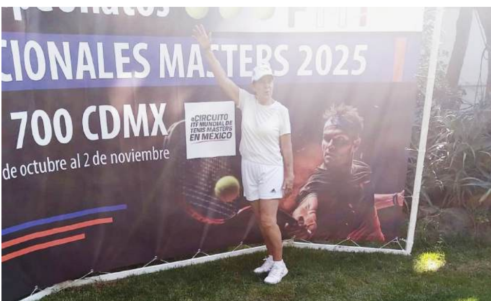
Tras disputar el partido decisivo, en la foto del recuerdo.

Todos los pormenores de inscripciones se pueden consultar en el portal www.granretto.com en donde conocerán las convocatorias oficiales de cada uno de los eventos que conforman el serial internacional de aguas abiertas Gran Retto.