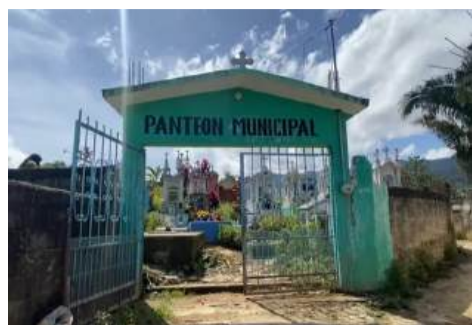
La quema de desechos sólidos a cielo abierto es un delito ambiental que puede conllevar multas significativas.