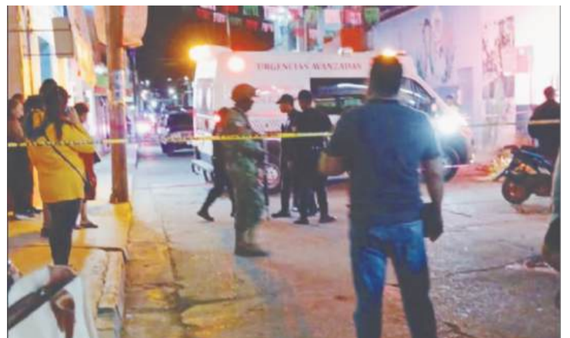
La zona del crimen fue acordonada para la práctica de las diligencias de ley.