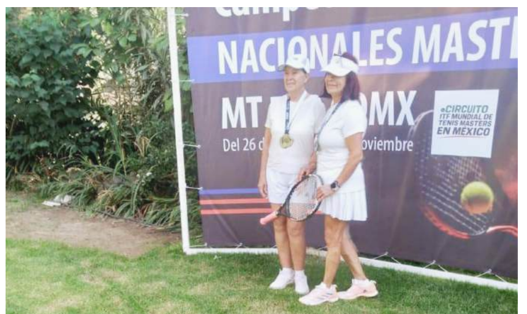
Luego de la premiación, a lado de la jugadora que fue finalista.