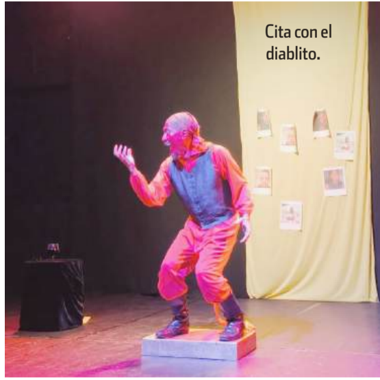
Cita con el diablito.

nes en los más diversos escenarios, ambos cuentan con un dominio pleno de su herramienta de trabajo, maestría en la interacción con el público y el reconocimiento de importantes personajes del teatro nacional.