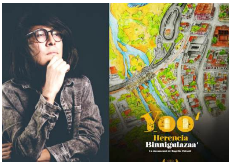
Es un retrato muy personal, íntimo y nostálgico de Tehuantepec, afirma el joven cineasta.