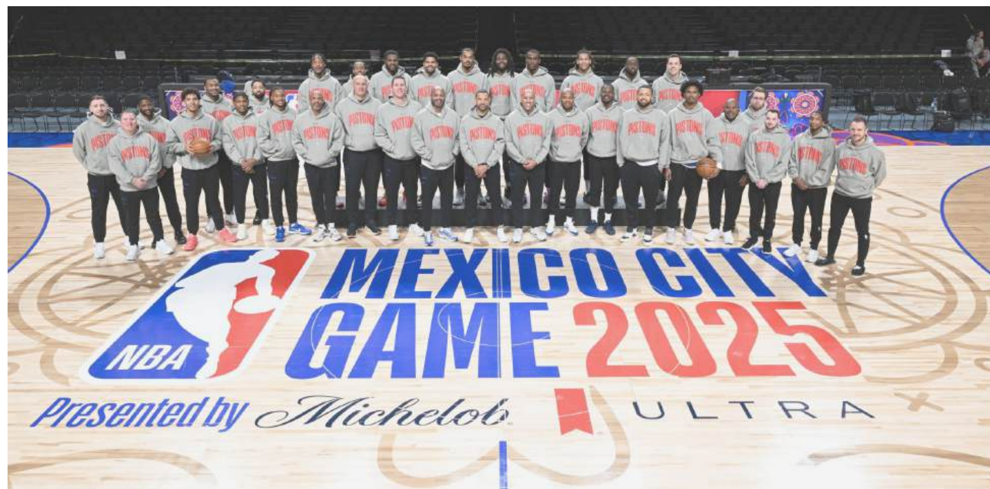
Los Pistons de Detroit jugarán esta noche en la Arena de la Ciudad de México

En su primer año con el Madrid, Mbappé convirtió cada partido en un espectáculo. Su velocidad, su frialdad frente al arco y su hambre competitiva lo colocaron por encima de Viktor Gyökeres (39 goles, 58.5 puntos) y Mohamed Salah (29 goles, 58 puntos).