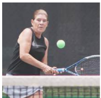
Volvió a conquistar el campeonato del Nacional Máster de ITF.

En la competencia que formó parte del calendario del Circuito Mundial de