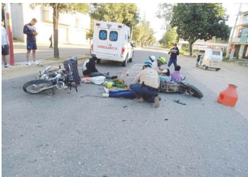
Tres personas quedaron con lesiones al chocar dos motocicletas en la carretera a Cuilápam de Guerrero.

civil de Cuilapam de Guerrero luego de valorarlos los trasladaron al lugar para auxiliar y valorar a los tres lesionados y