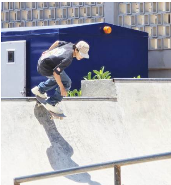
Mostarán su mejor técnica en el parque.