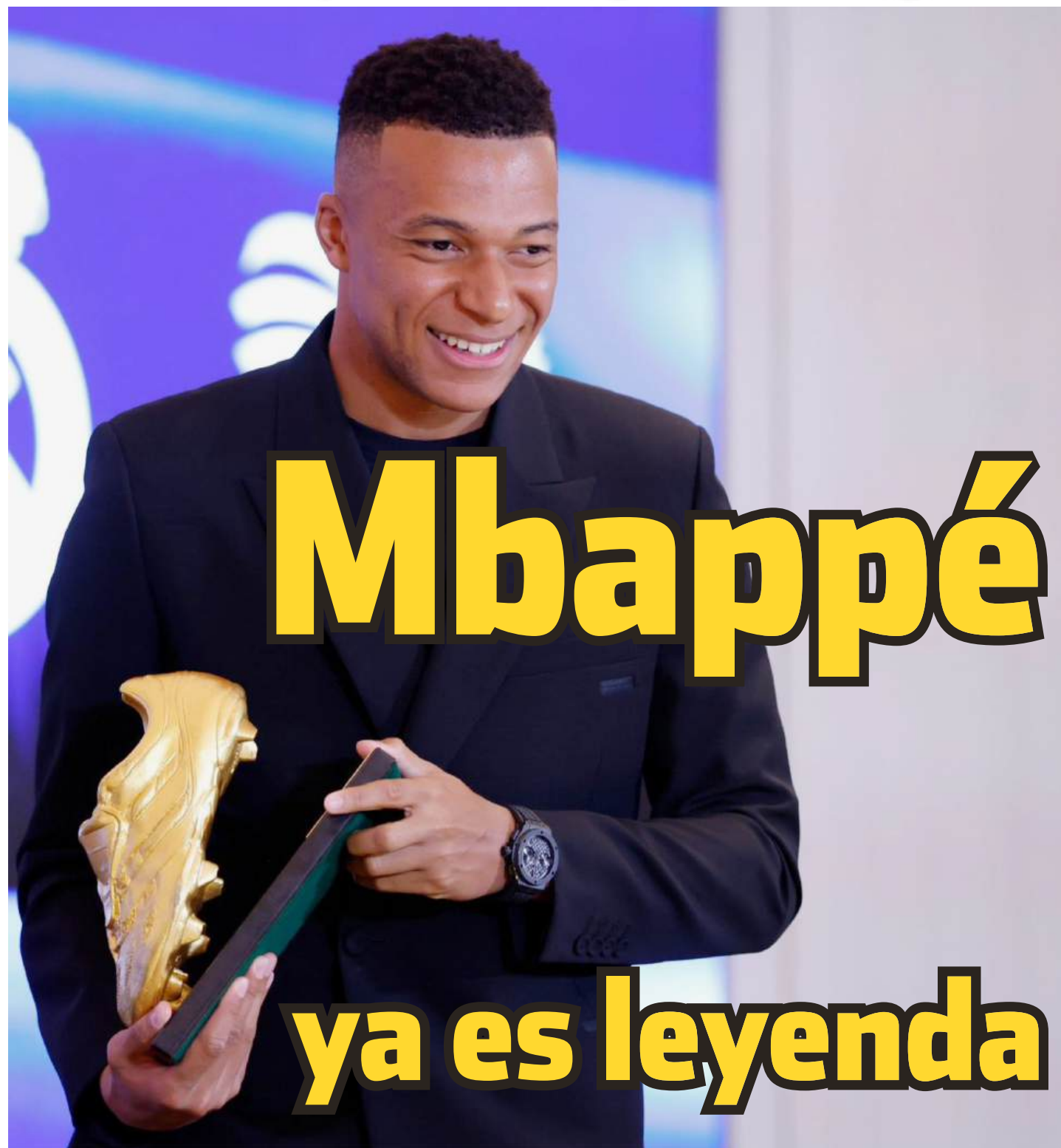
El delantero francés fue premiado con la Bota de Oro, como el máximo goleador de toda Europa

Tras esto, después de seis años, la Serie Mundial se irá al Juego 7 definitivo. Del lado de Blue Jays, Max Scherzer será el pitcher abridor, mientras que los Dodgers apuntan a tener a Shohei Ohtani para el inicio del juego, con la disponibilidad de todos los lanzadores para salir desde el bullpen en cualquier momento del juego para ambos equipos.