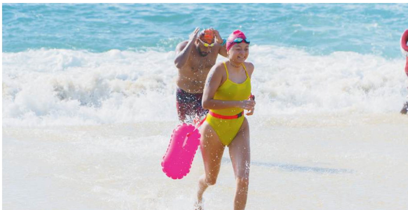
El 22 de noviembre se llevará a cabo el Gran Retto en Puerto Escondido.

Los nadadores podrán desafiar el mar con distancias de 500 metros, 1.5 kilómetros y la exigente Travesía Zicatela de cinco