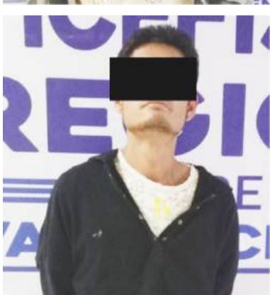
Dos de los detenidos, que junto con su madre, quedaron vinculados a proceso por el delito de violencia familiar, en agravio de su propia abuela.

ción y posteriormente, la vinculación a proceso en contra de B.E.C.T., B.G.C., y E.J.G.C., por el delito de violencia familiar, además de imponerles sus respectivas medidas cautelares y sus plazos de tiempo para las investigaciones complementarias.