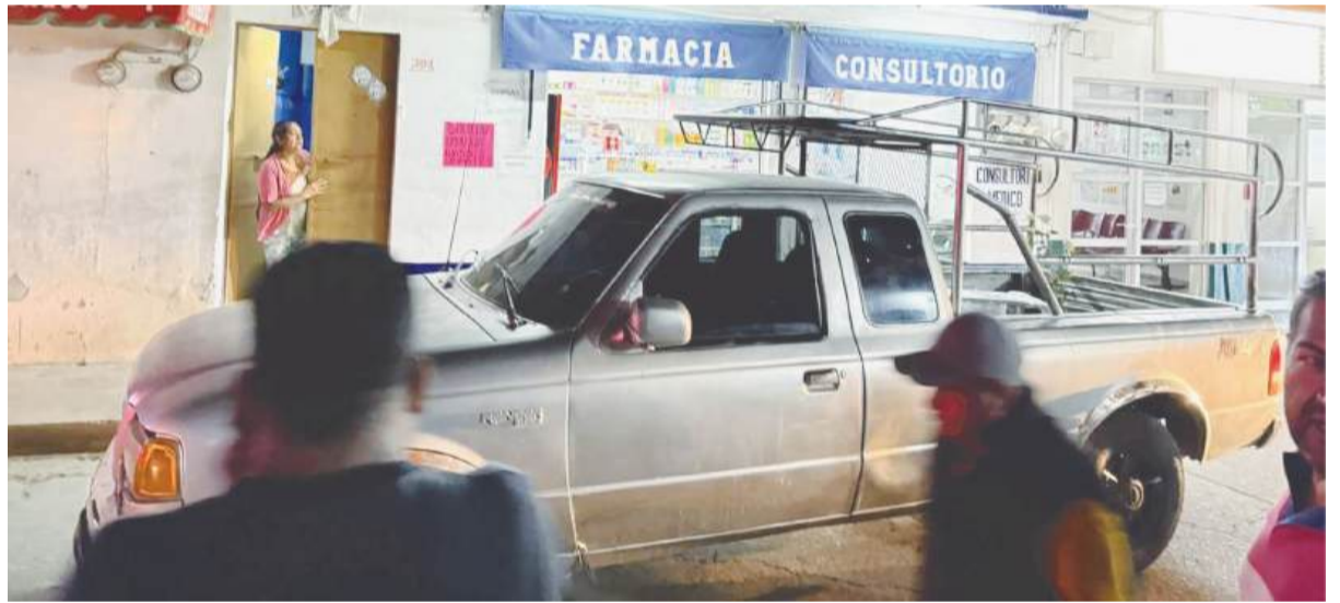
El crimen ocurrió en el centro de Miahuatlán de Porfirio Díaz.

La Fiscalía de Oaxaca reitera su compromiso de brindar atención integral y eficiente en casos de delitos cometidos en contra mujeres, para lo cual aplica protocolos con perspectiva de género que permitan brindar un proceso de procuración de justicia especializado y cercano a las víctimas.