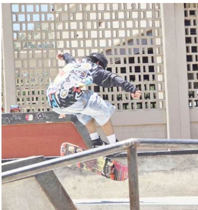
La competencia reunirá a skater's del país

Se repartirá una bolsa de 100 mil pesos en efectivo en la categoría libre, pero también se competirá en las divisiones infantil (10-14 años) y juvenil (15-17 años), en las cuales la premiación será en