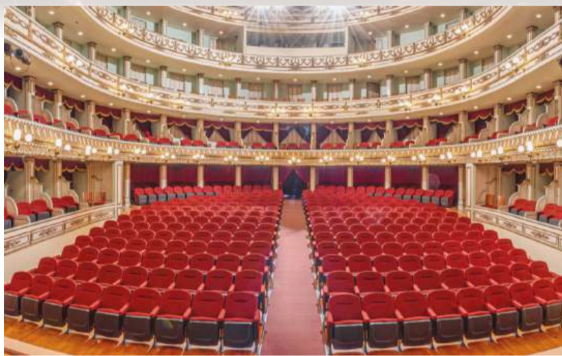
El Teatro Macedonio Alcalá será la sede.

La película Frankenstein , producida por Netflix, marca el regreso de Guillermo del Toro a la dirección tras el éxito de Pinocho