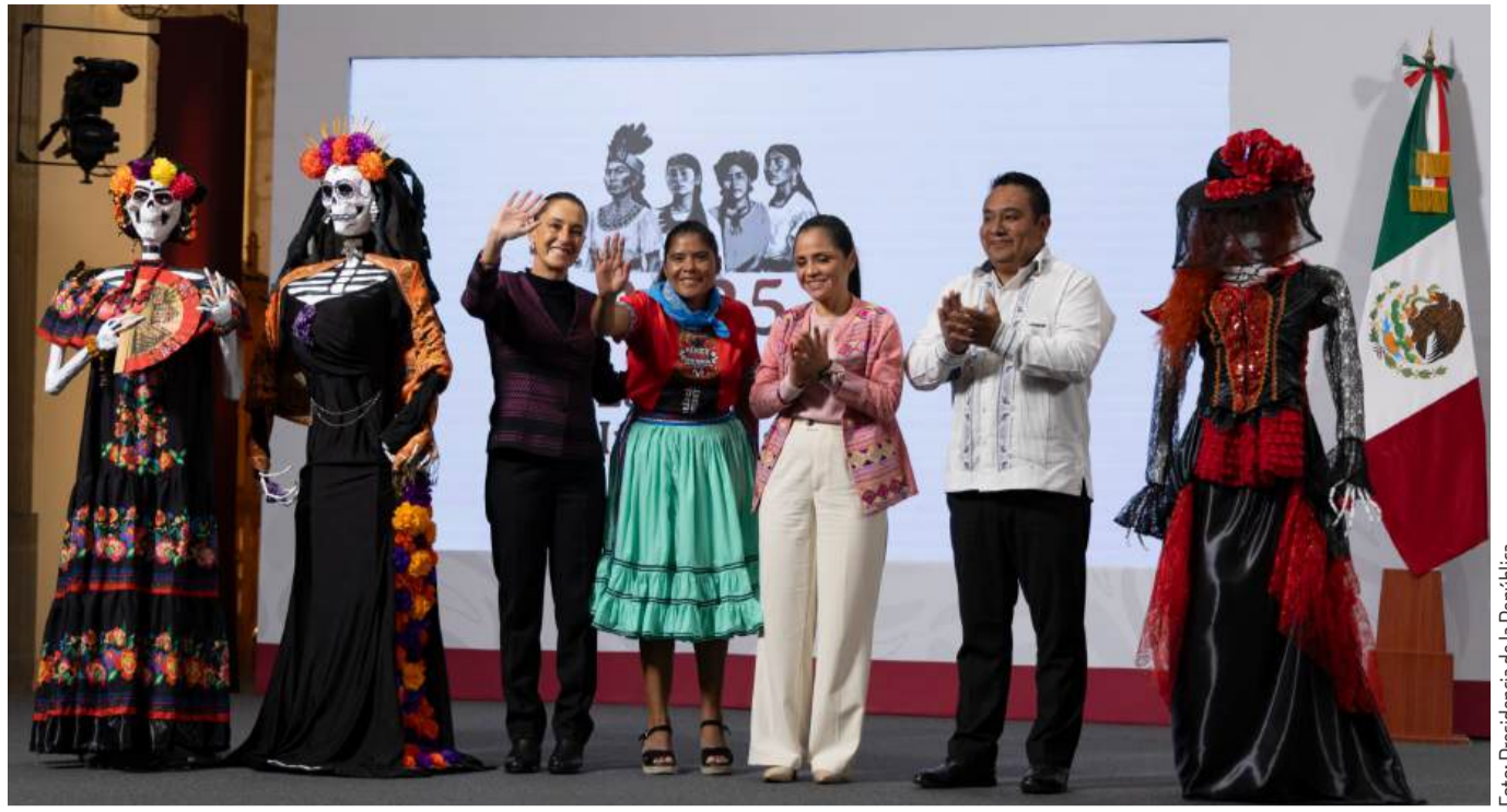
Apojarán el talento deportivo mexicano.

El Director Médico insistió en la importancia de que Nuevo Laredo cuente con un banco de sangre propio, lo que permitiría atender la demanda de forma segura y sin intermediarios.