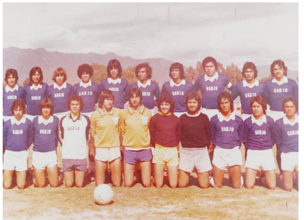
Aquel histórico primer equipo de Oaxaca en la Tercera División Profesional, Linces UABJO.

competencia y convivencia entre los mejores exponentes nacionales, promoviendo la cultura urbana como una forma de expresión artística y deportiva.