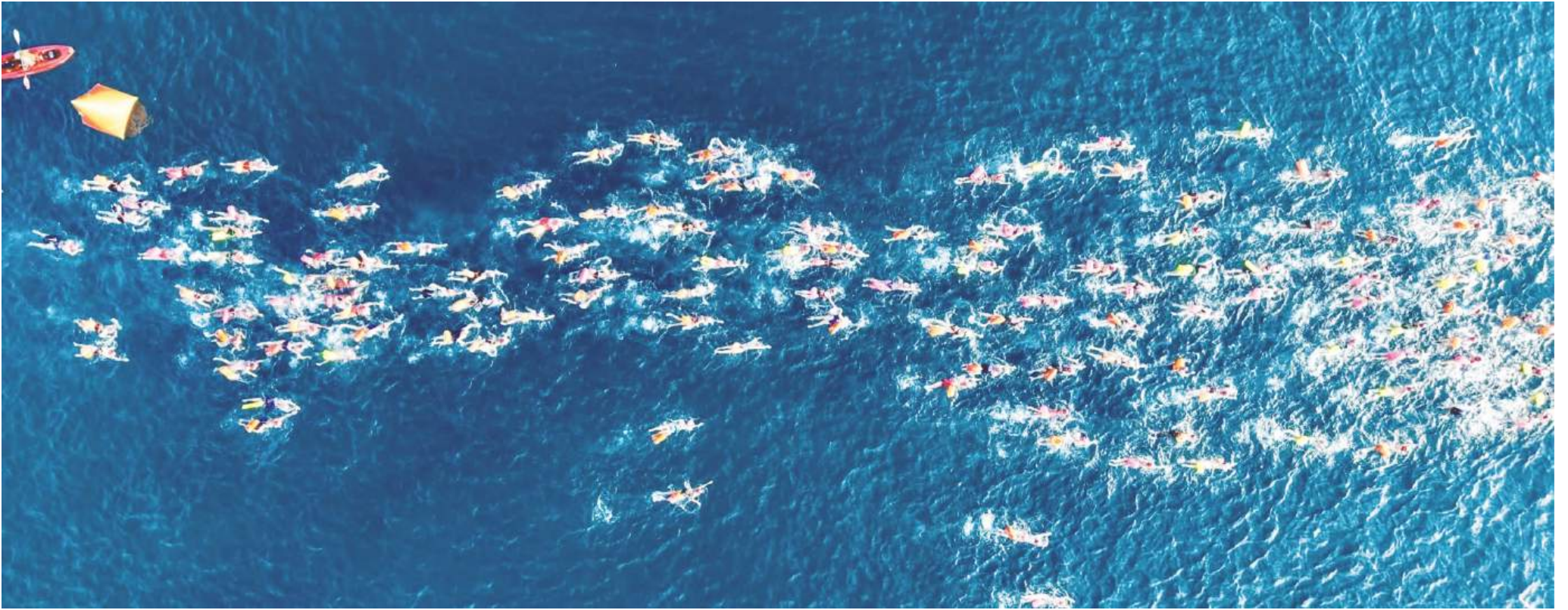
El Gran Retto de Aguas Abiertas llega por vez primera a Puerto Escondido.