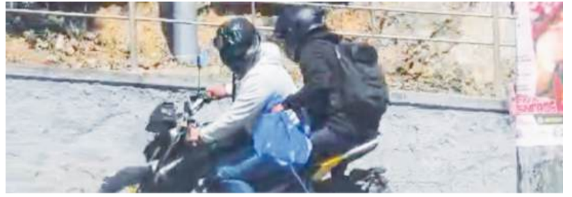
Los dos delincuentes lograron huir por la carretera del Cerro del Fortín, sin ser detectados por las cámaras de vigilancia.

Debido a la nula reacción de la policía, ciudadanos señalaron que los asaltantes operan con la presunta protección de policías, quienes les dieron tiempo para poder huir.